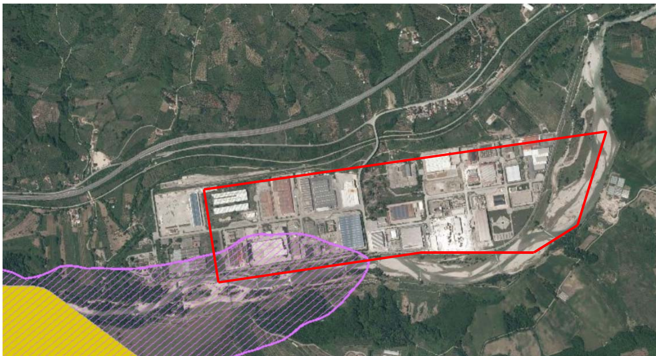
Area Industriale di Buccino